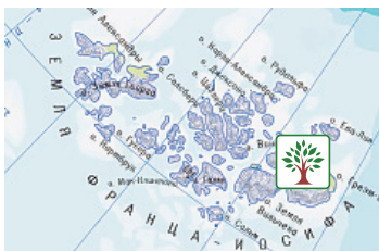
Земля Франца Иосифа