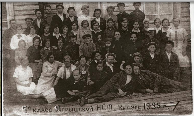
7-ой класс Ягрышской НСШ. Выпуск 1935 г.

Этот снимок сделан в ноябре 1927 года после демонстрации, посвященной 10-ой годовщине Великой Октябрьской революции, в классе нового здания школы. Здесь запечатлены лица первых учащихся Ягрышской школы крестьянской молодежи.