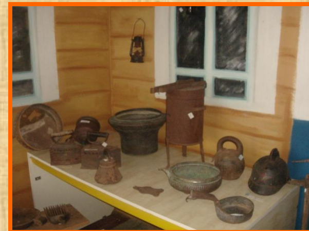
Самовар, ендова, углевой утюг .....

3 раздел «Изделия из металла и их значение в быту».