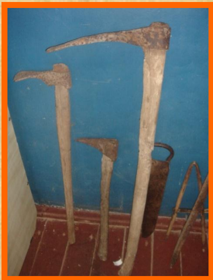
Орудия обработки земли.