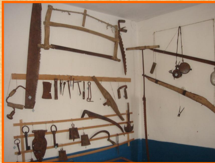
Чем мы можем дом построить.