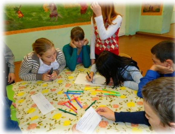
Я человек –мысль природы и ее разум