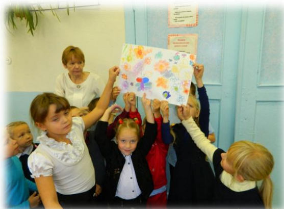
Мои соседи по планете